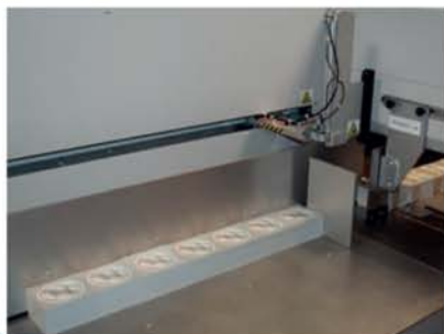
1. 手动放入一列纸堆