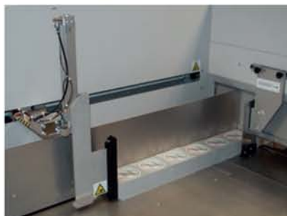
2. 自动推送并压紧纸堆