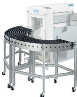
180°滚轮传送带 (由两个90°滚轮传送带组成)